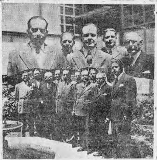
Al medio día de ayer, fue... PASA a la pág. 2, col. 7)